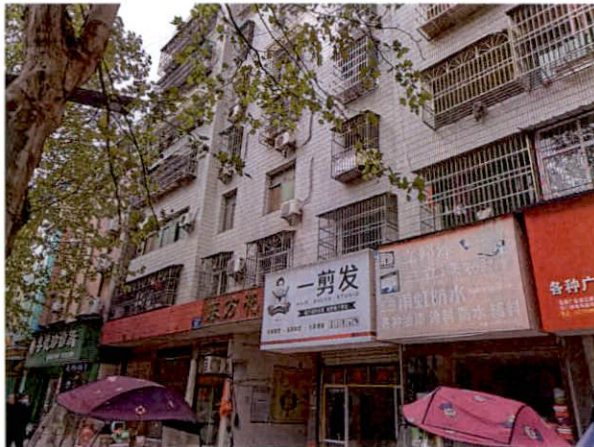
估价对象所在楼正面外观