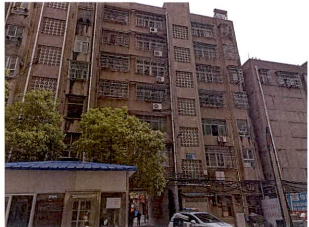
估价对象所在楼背面外观