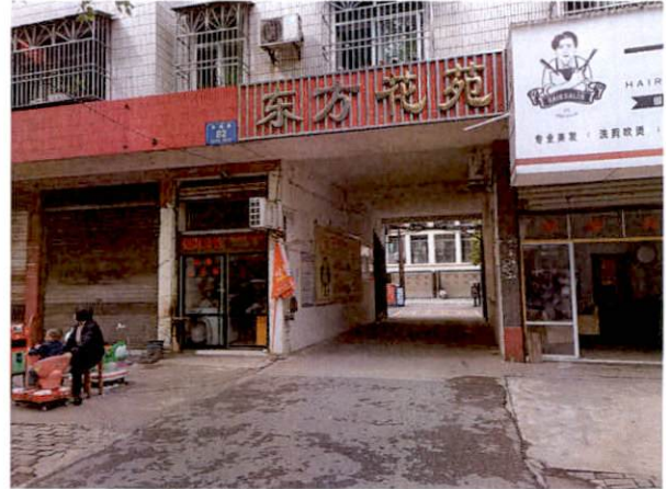
估价对象小区入口