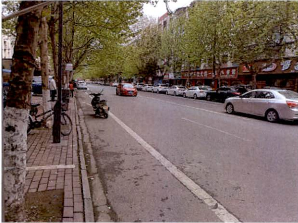
估价对象周边道路一