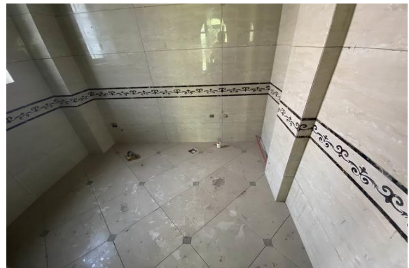
1 层室内实景 5