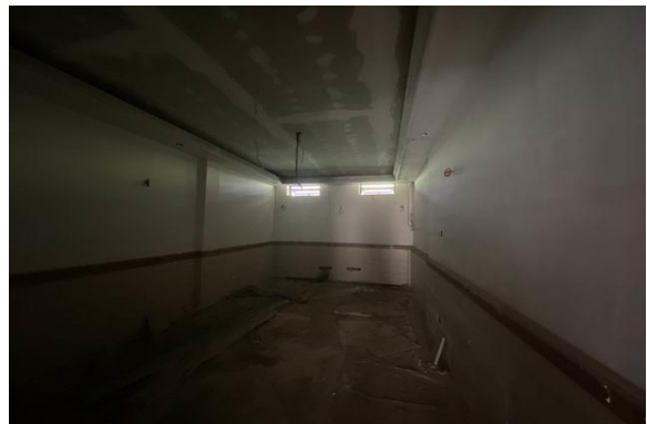
地下室一层室内实景 1