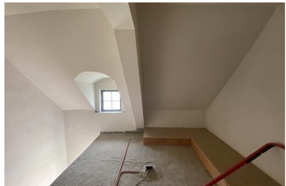
顶层阁楼室内实景 2