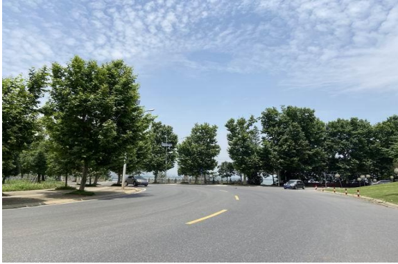
项目临路状况 1 (湖景南路)