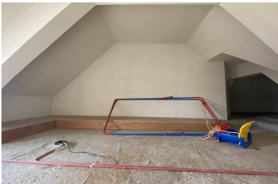
顶层阁楼室内实景 1