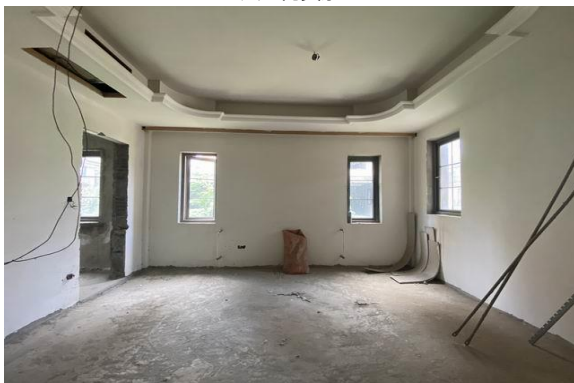
2 层室内实景 3