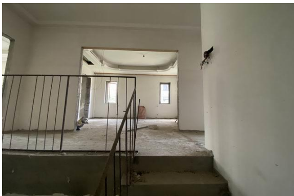
2 层室内实景 1