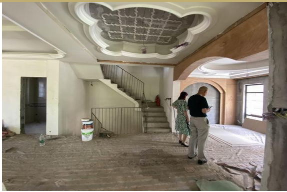
1 层室内实景 2