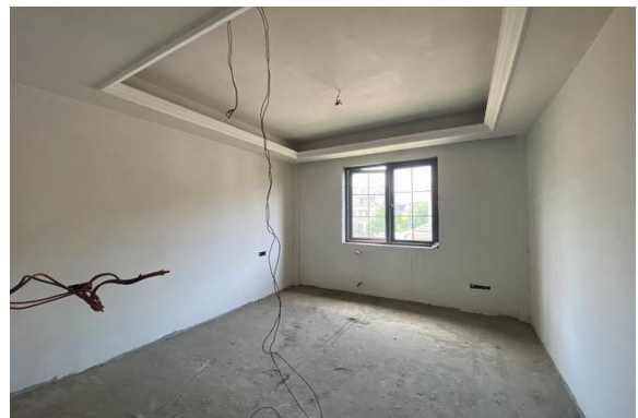
2 层室内实景 2