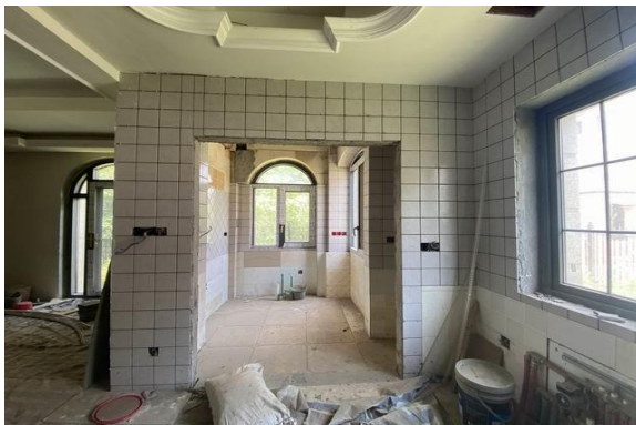
1 层室内实景 4