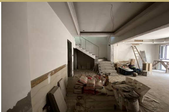
地下室一层室内实景 2