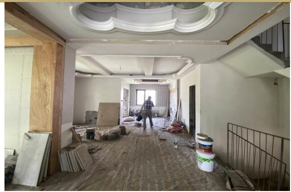
1 层室内实景 3