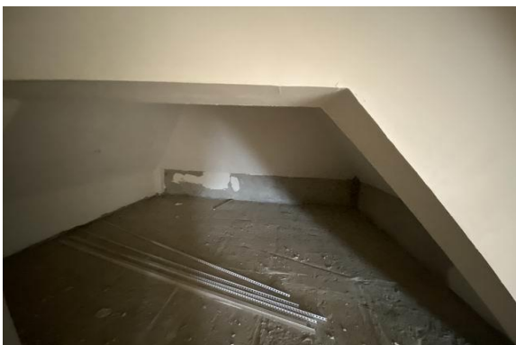
顶层阁楼室内实景 3