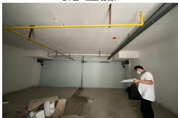
地下室二层室内实景 1