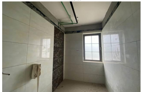
2 层室内实景 4