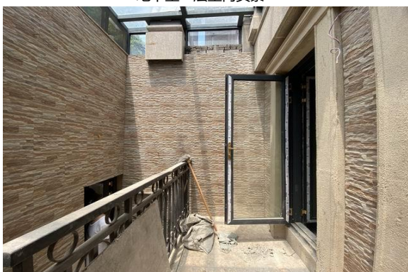
地下室一层室内实景 4