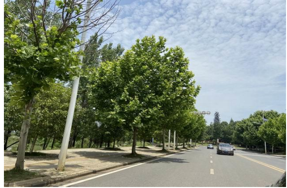
项目临路状况 2 (湖景南路)