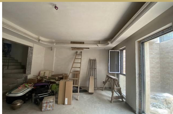
地下室一层室内实景 3