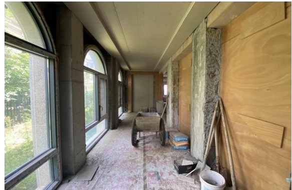
1 层室内实景 1