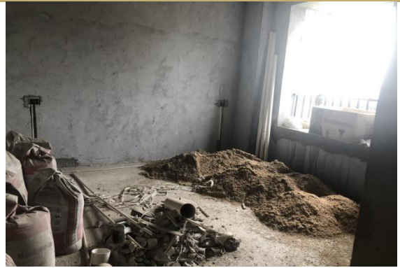
2501 室内景 3