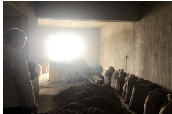
2501 室内景 1