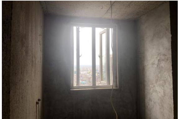
2501 室内景 5