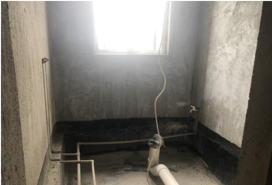
2501 室内景 4