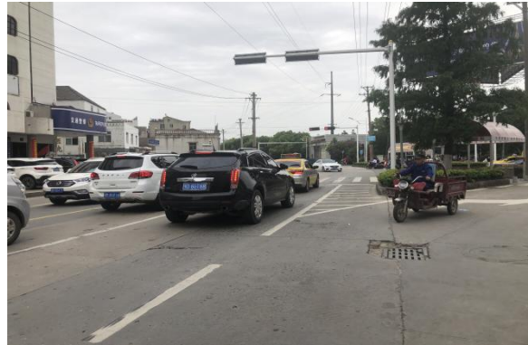
项目临路状况 2 (仙源大道)