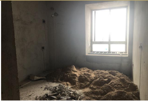
2501 室内景 2