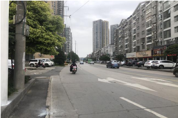
项目临路状况 1 (仙源大道)