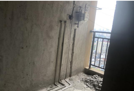
2501 室内景 6