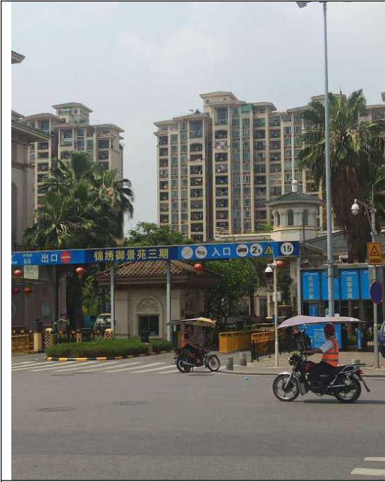
标的所在小区门口