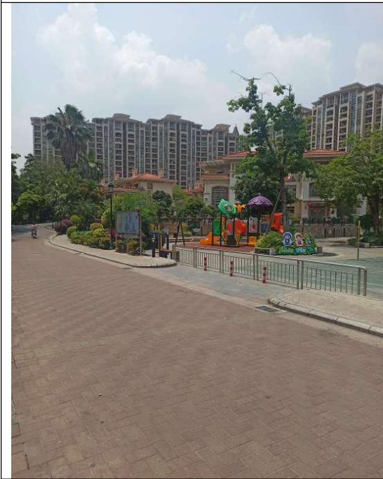
标的所在小区内部环境