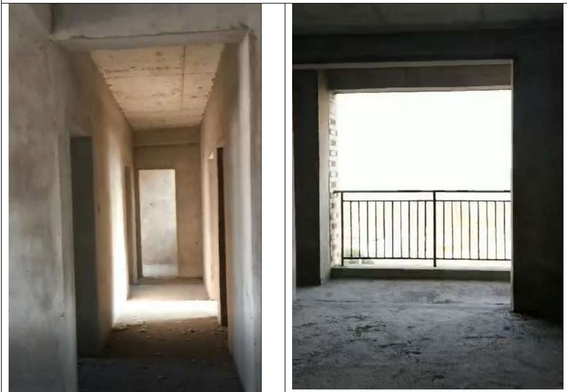
部分住宅室内照片