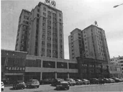
估价对象栋楼外景