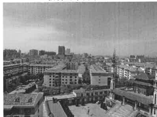
估价对象周围环境