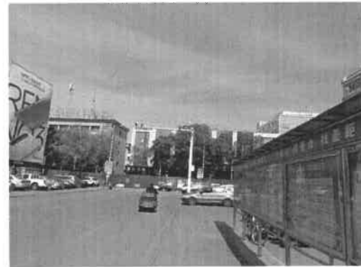
估价对象周围环境