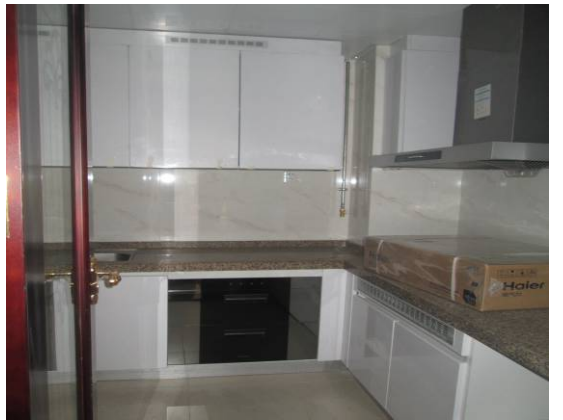
估价对象内外部状况及周围环境和景观照片