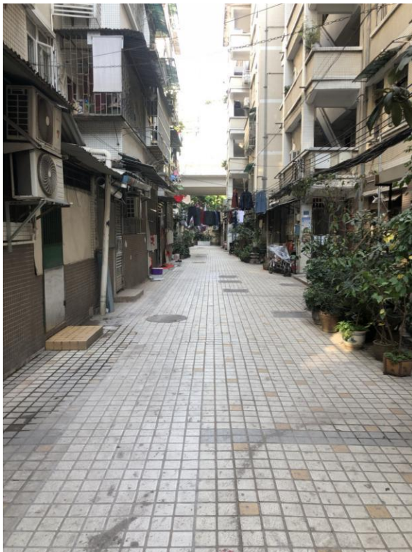
标的所在小区内部环境