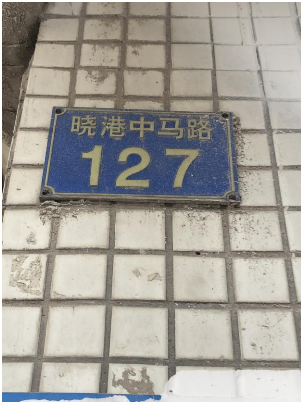
标的所在楼宇行政地址