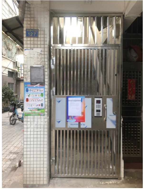
标的所在楼宇入口