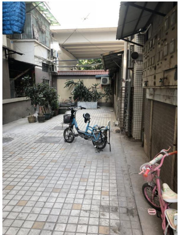
标的所在小区内部环境