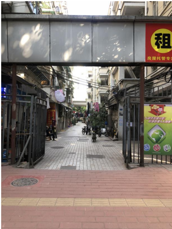
标的所在小区门口