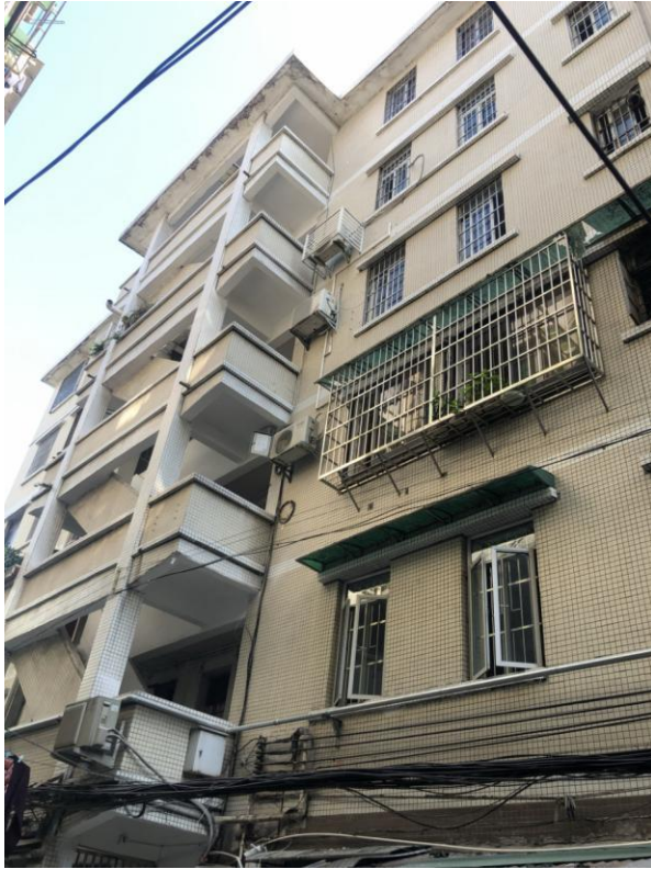
标的所在楼宇外观