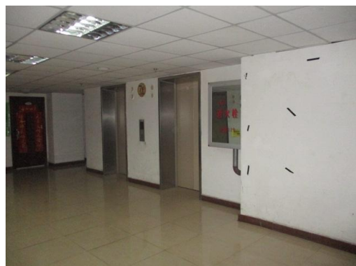
估价对象实景照片