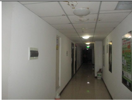
估价对象实景照片