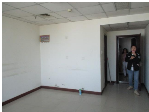
估价对象实景照片