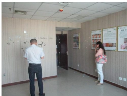
估价对象实景照片