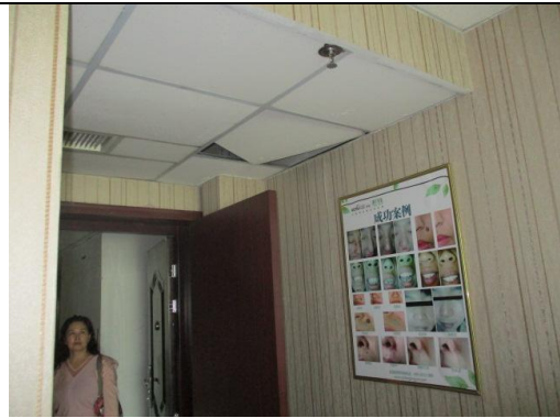
估价对象实景照片