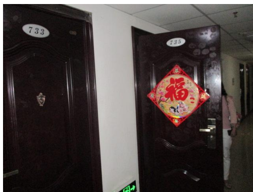
估价对象实景照片