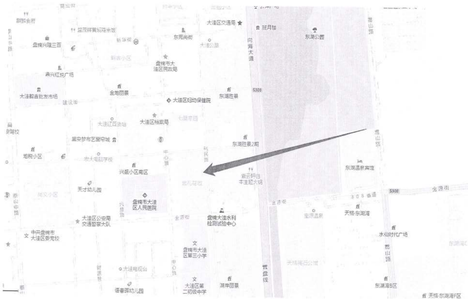
估价对象位置示意图