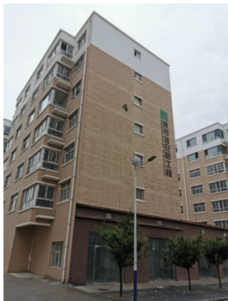
图 2 估价对象楼幢外观照片

估价对象所在永坪镇永州小区 4 号楼，3 个单元，地上 7 层，单元内每层 2 户，混合结构，建成于 2017 年，该建筑物外墙涂料；公共区域地面水泥抹平，墙、顶刷白；楼梯地面水泥地面，墙顶刷白；天然气、网络、消防栓等设施齐全，估价对象所在建筑外观照片见图 2：