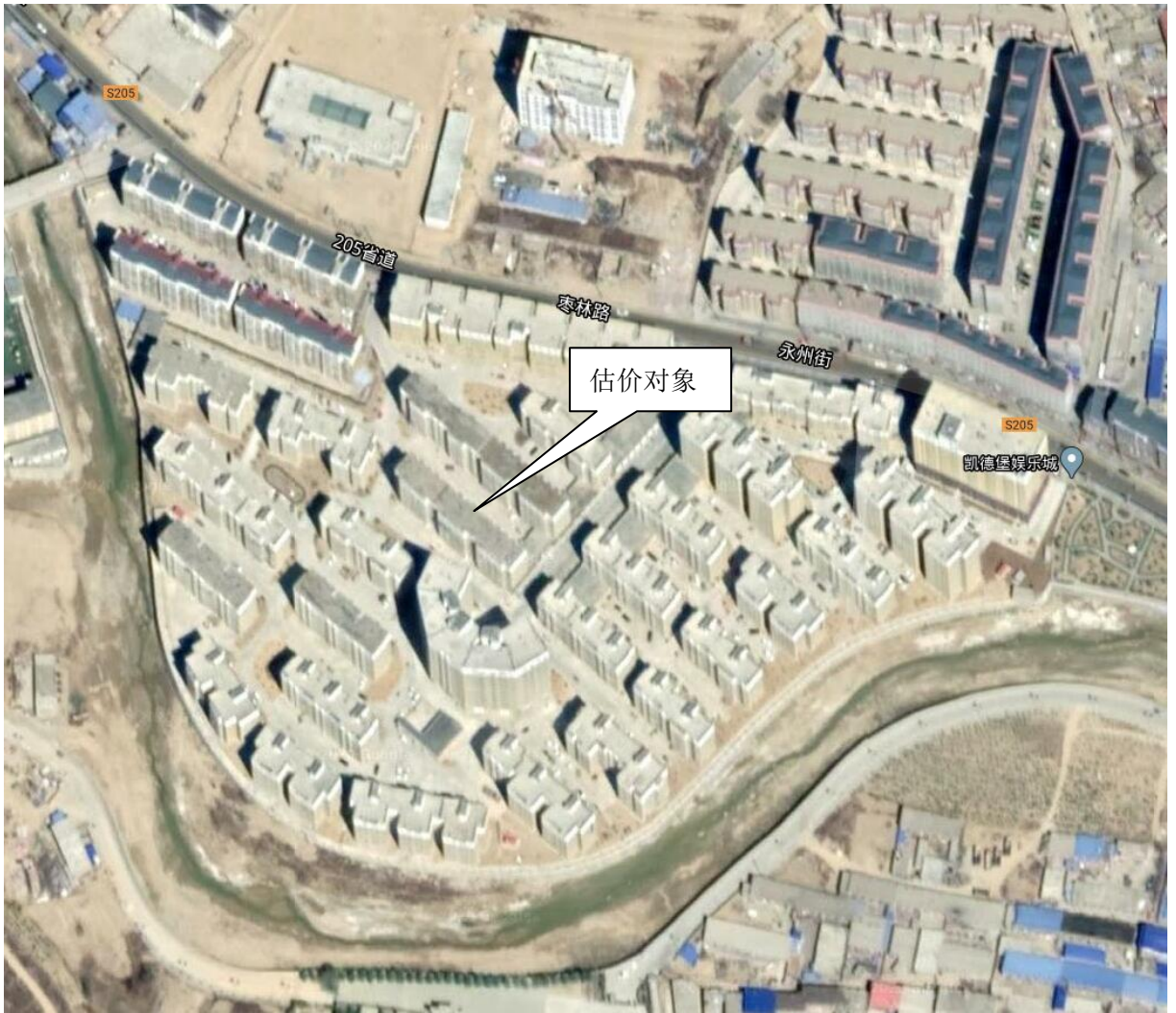
图 1 估价对象位置示意图

估价对象所在永坪镇永州小区 4 号楼，3 个单元，地上 7 层，单元内每层 2 户，混合结构，建成于 2017 年，该建筑物外墙涂料；公共区域地面水泥抹平，墙、顶刷白；楼梯地面水泥地面，墙顶刷白；天然气、网络、消防栓等设施齐全，估价对象所在建筑外观照片见图 2：