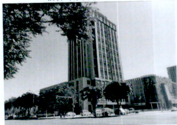
估价对象周围环境