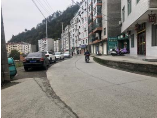
邻近道路状况(大裕路)