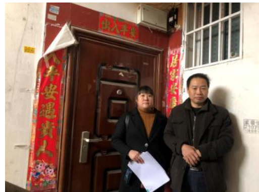
入户门及现场估价师