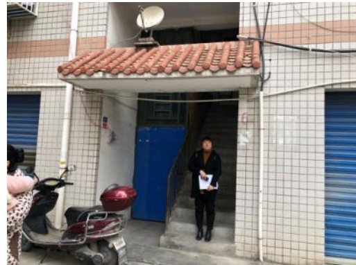
单元入口及现场估价师