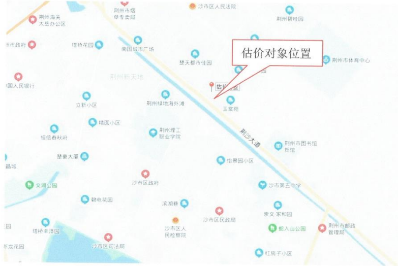
估价对象区域位置示意图