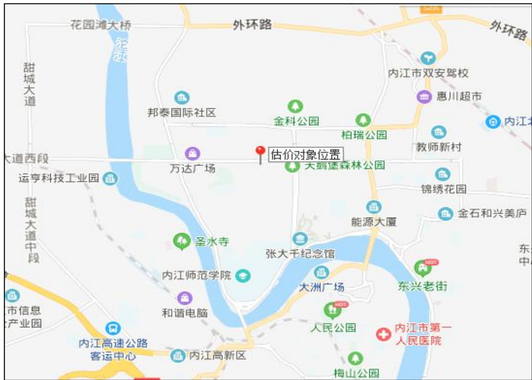
附件一：估价对象位置示意图