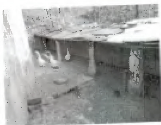
估价对象利用现状照片