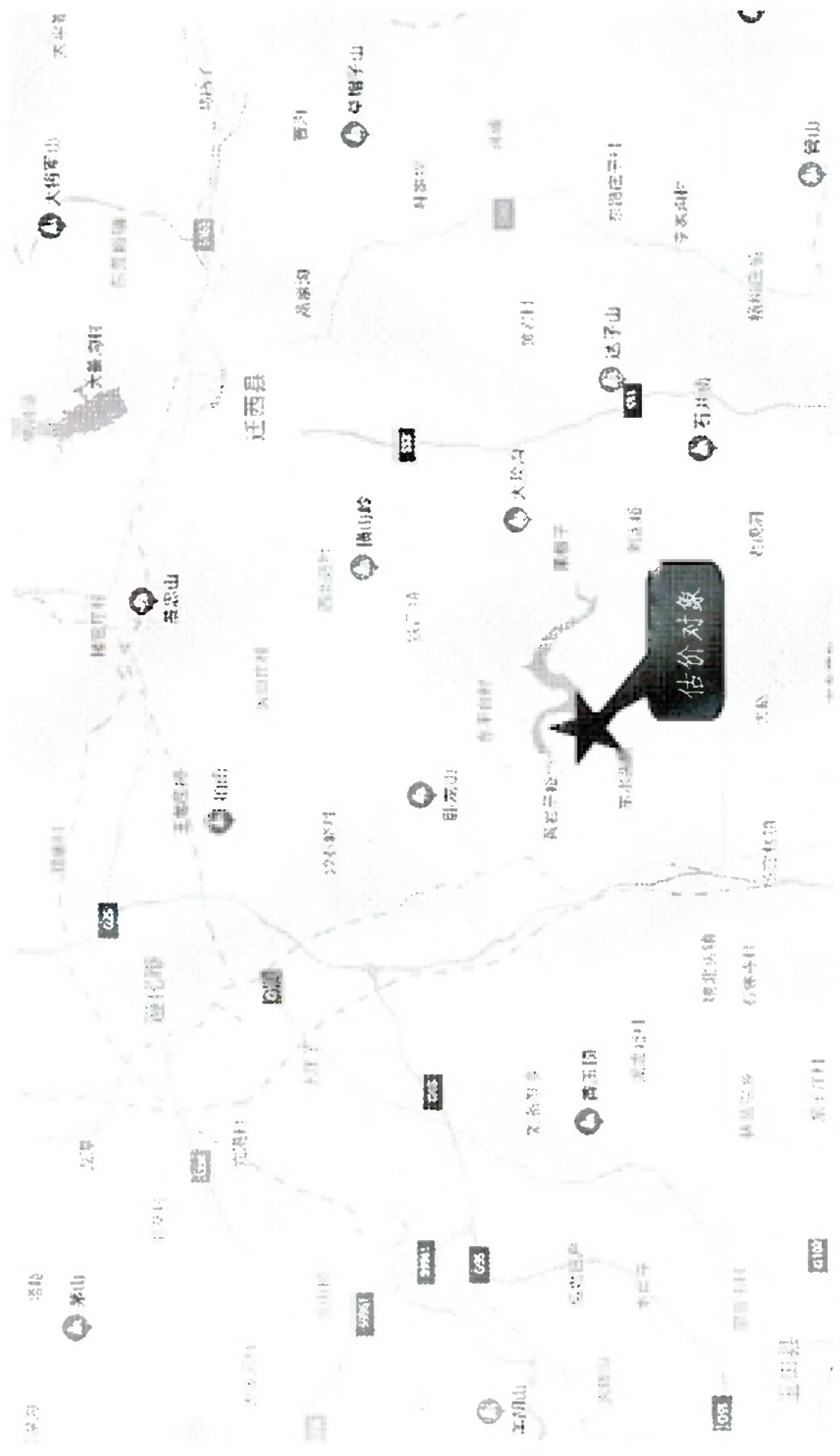
估价对象位置示意图