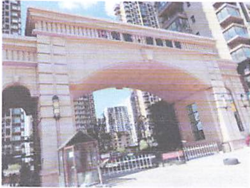
估价对象所在小区