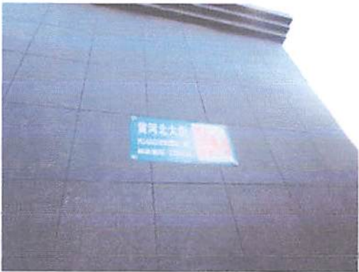
估价对象所在楼蓝牌号