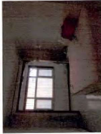
估价对象利用现状照片