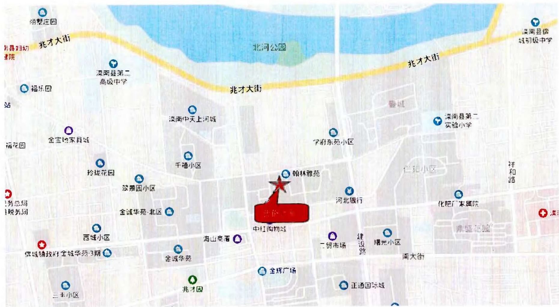
估价对象位置示意图