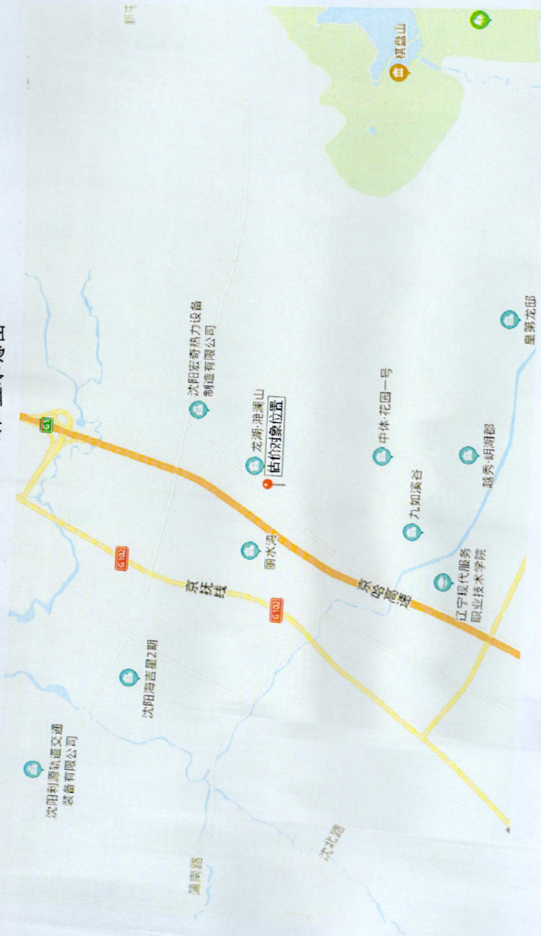
估价对象区域位置示意图