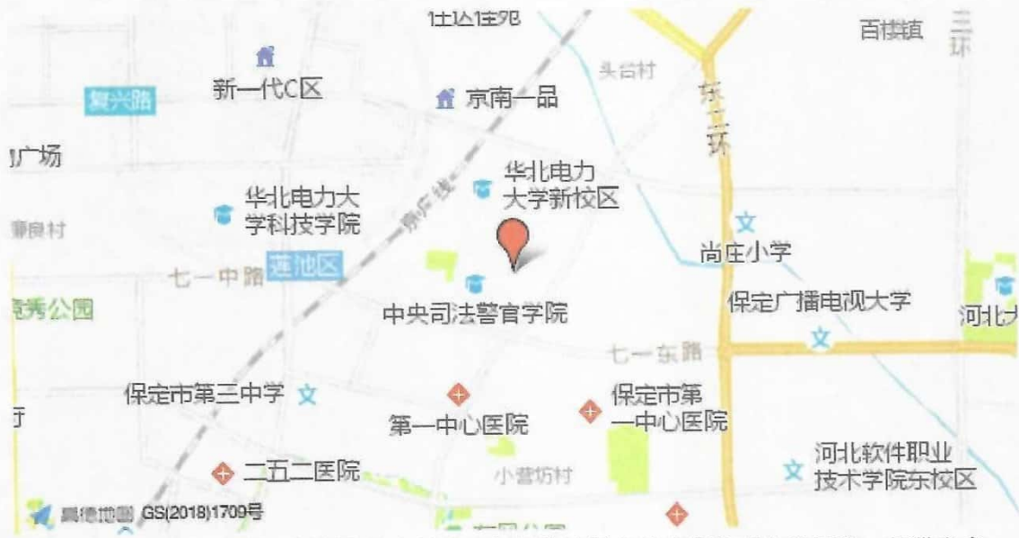
注：数据源自高德地图，根据询价方提供的标的物房屋坐落信息生成定位标注，仅供参考