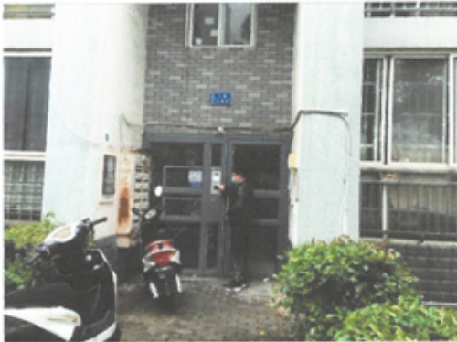
估价对象单元入口