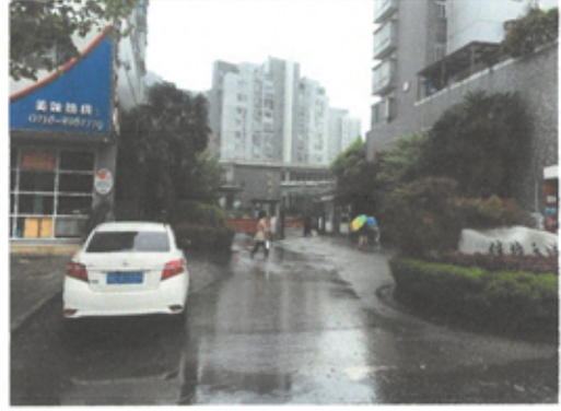
估价对象小区入口