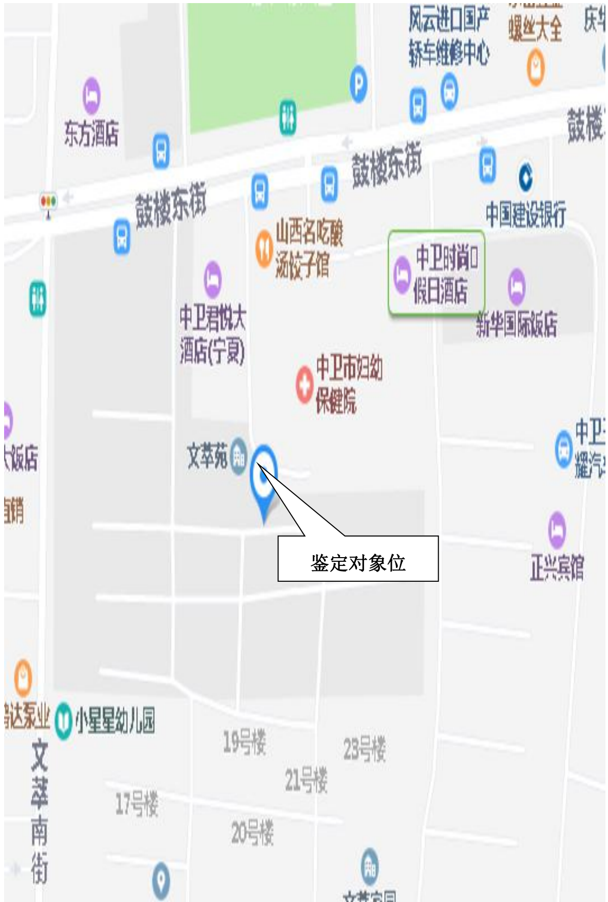
(鉴定对象位置示意图)