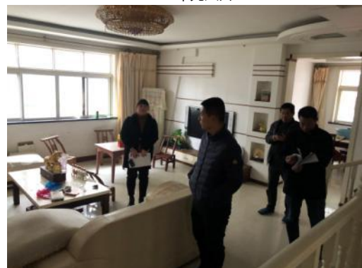
客厅及现场估价师