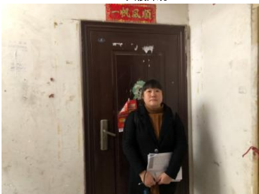
入户大门及现场估价师