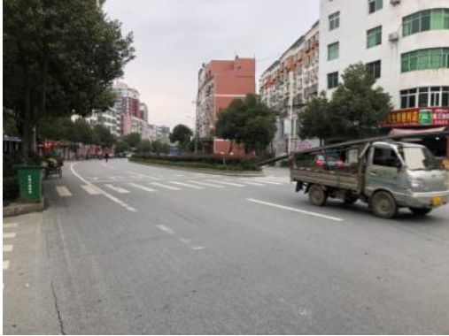
邻近道路状况(鄂陕大道)