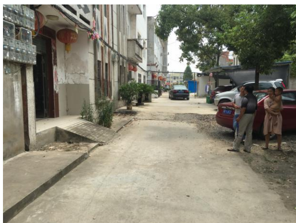
估价对象门口道路