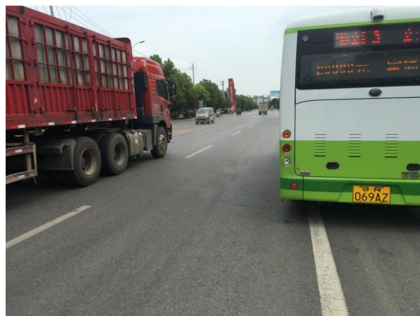
估价对象周边道路二