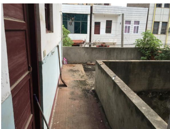
估价对象二楼走道