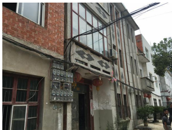
估价对象整体外观