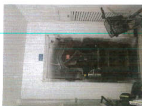
估价对象利用现状照片