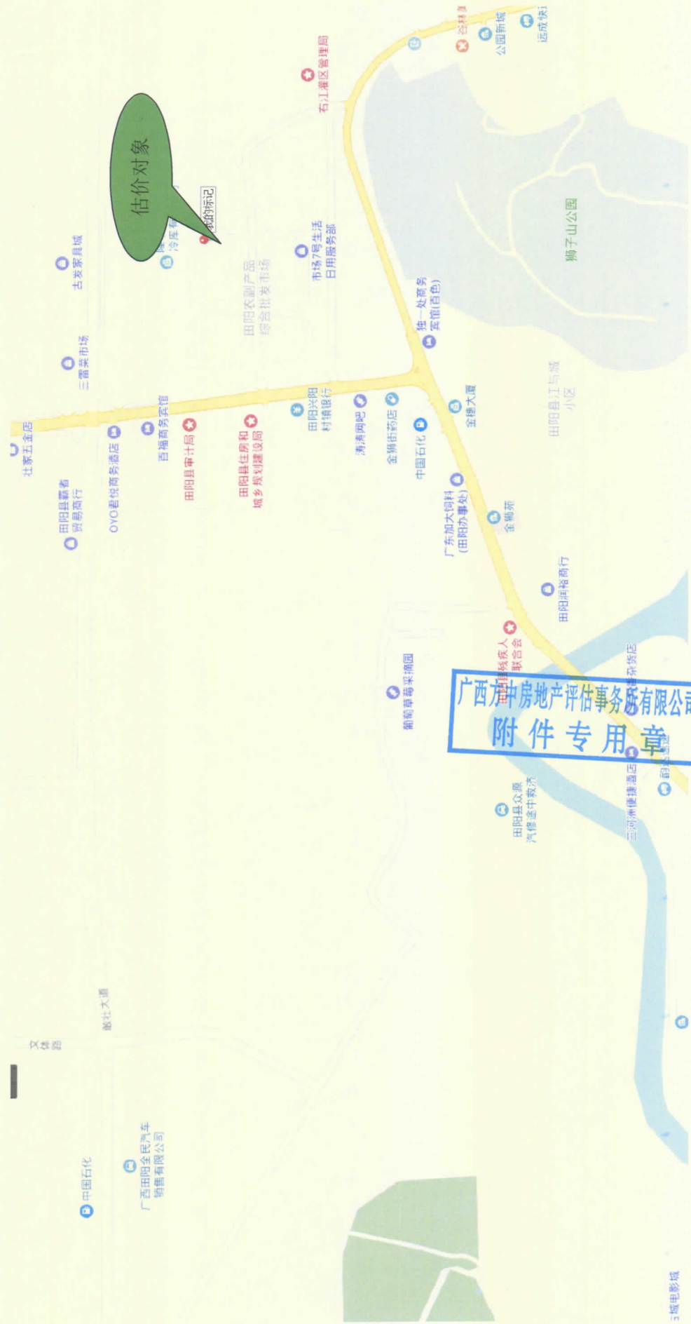
田阳县三雷农副产品批发市场第 28 号位置示意图