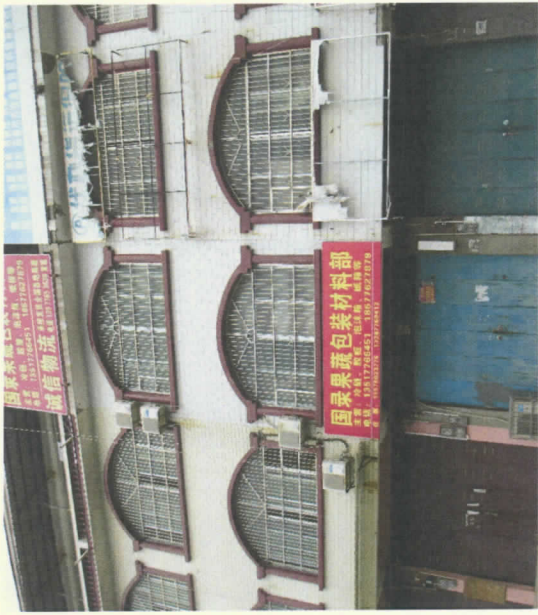
估价对象建筑物外观