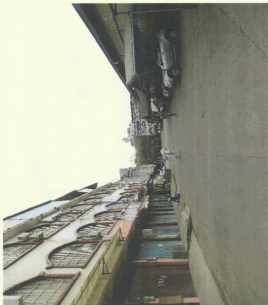
估价对象周边环境