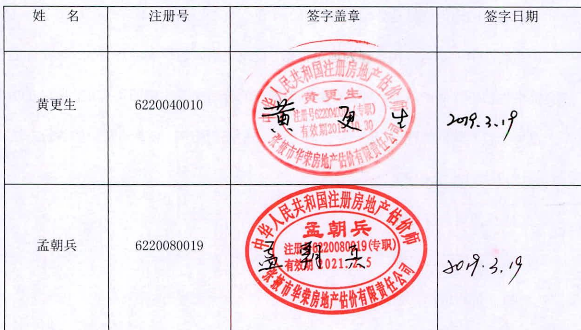
表一：参加估价的注册房地产估价师