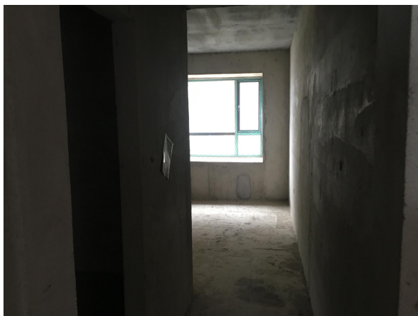
估价对象内部状况二