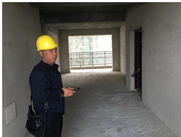
估价对象内部状况五