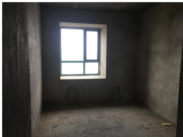
估价对象内部状况一