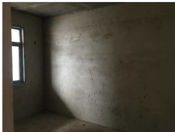
估价对象内部状况四