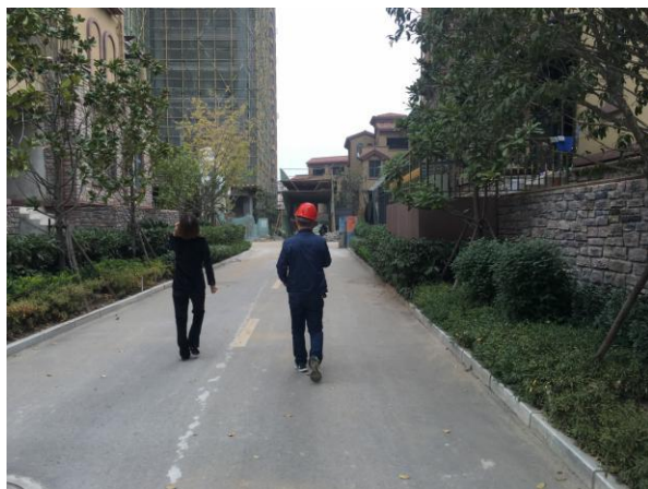
估价对象内部道路