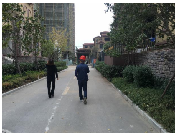
估价对象内部道路