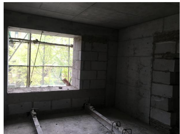
估价对象内部状况六