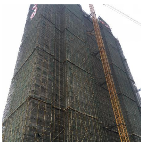
估价对象所在 33#楼整体外观