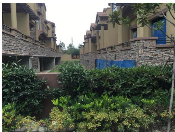
估价对象内部景观