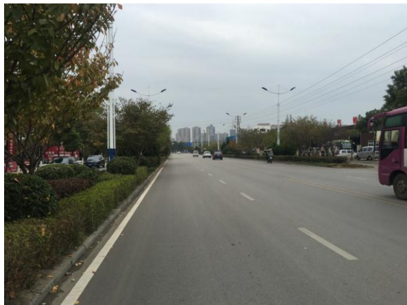
估价对象周边道路二