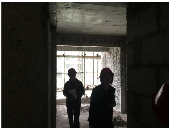
估价对象内部状况三