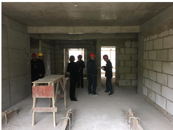
估价对象内部状况一