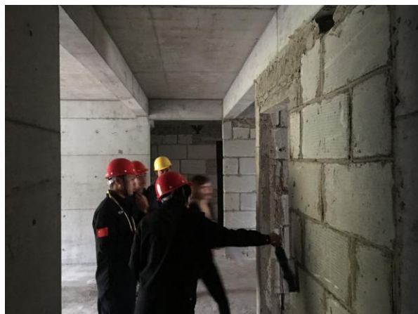
估价对象内部状况二