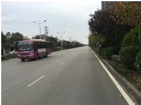
估价对象周边道路一