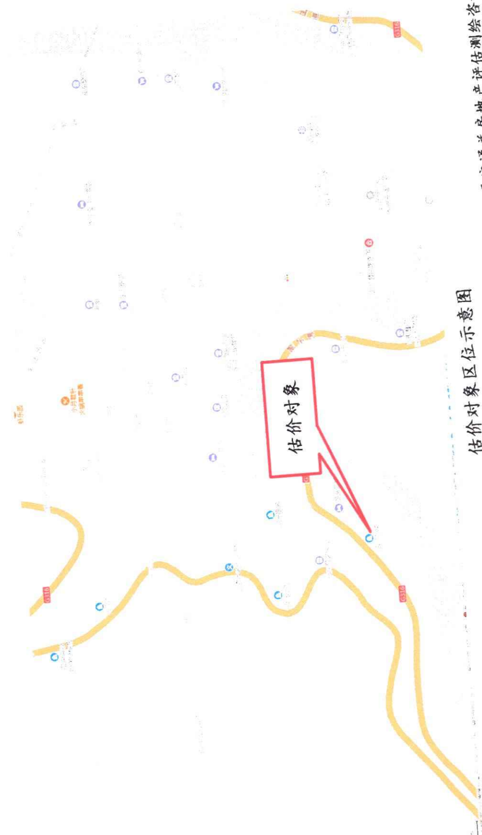
估价对象区位示意图