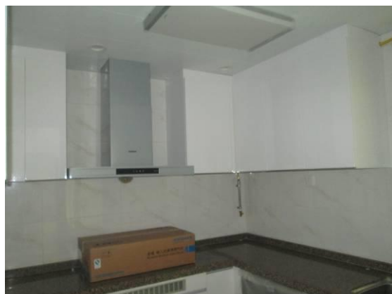
估价对象内外部及周围环境和景观照片