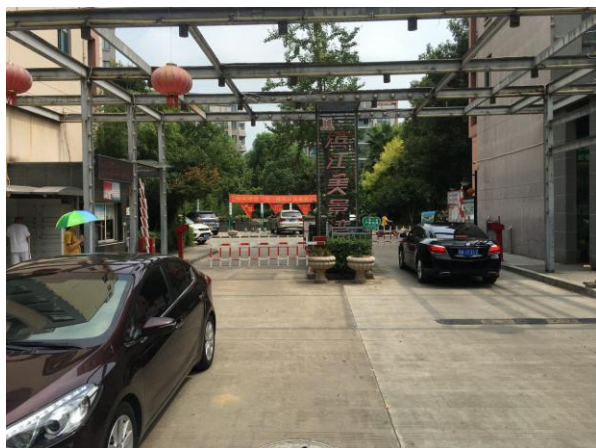
估价对象小区大门