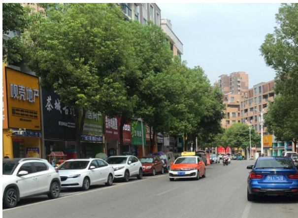
估价对象周边道路一