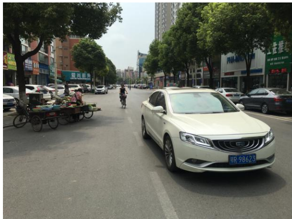
估价对象周边道路二