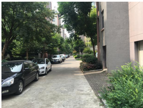
估价对象小区道路