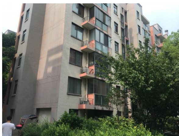
估价对象整体外观