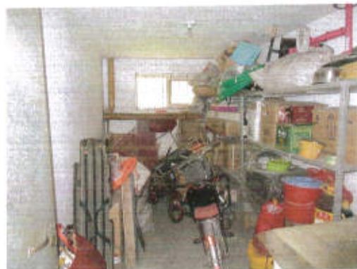
估价对象现状利用照片