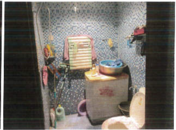
估价对象利用现状照片