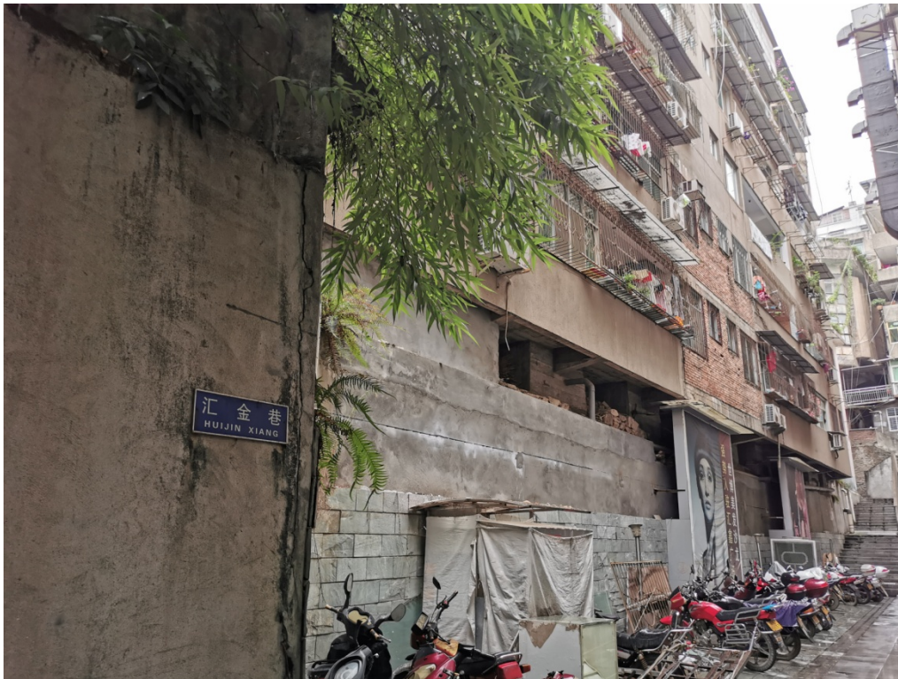
图 2 估价对象楼幢外观照片