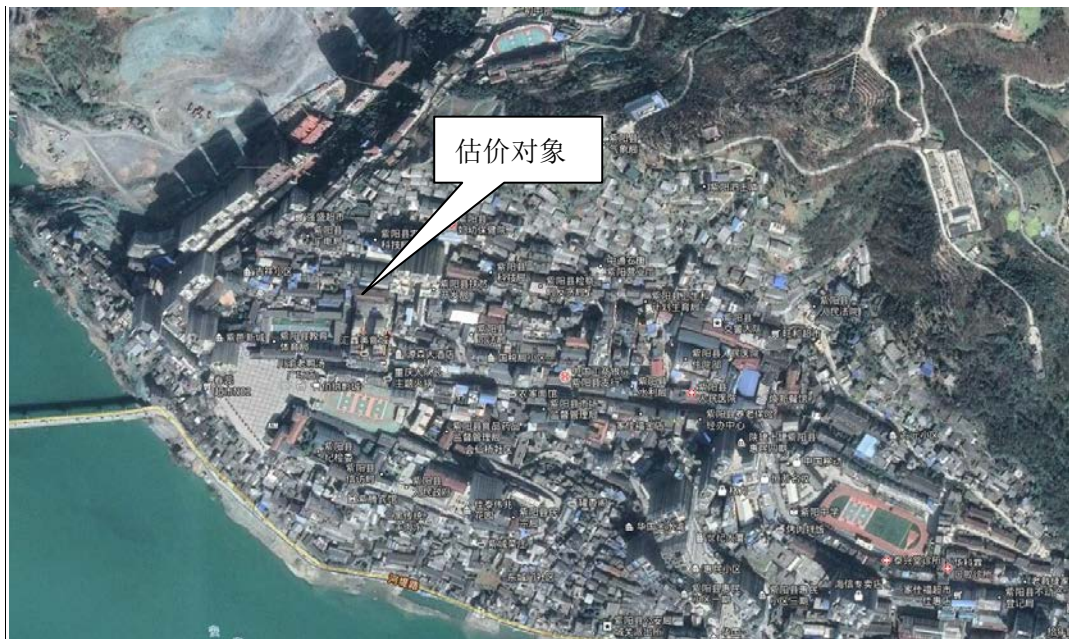
图 1 估价对象位置示意图

估价对象所在楼幢为 1 栋多层住宅楼，两个单元，配有有线电视、宽带、电话等管线入户，基础配套设施较齐全，物业管理水平一般。估价对象所在小区位置示意图如下：