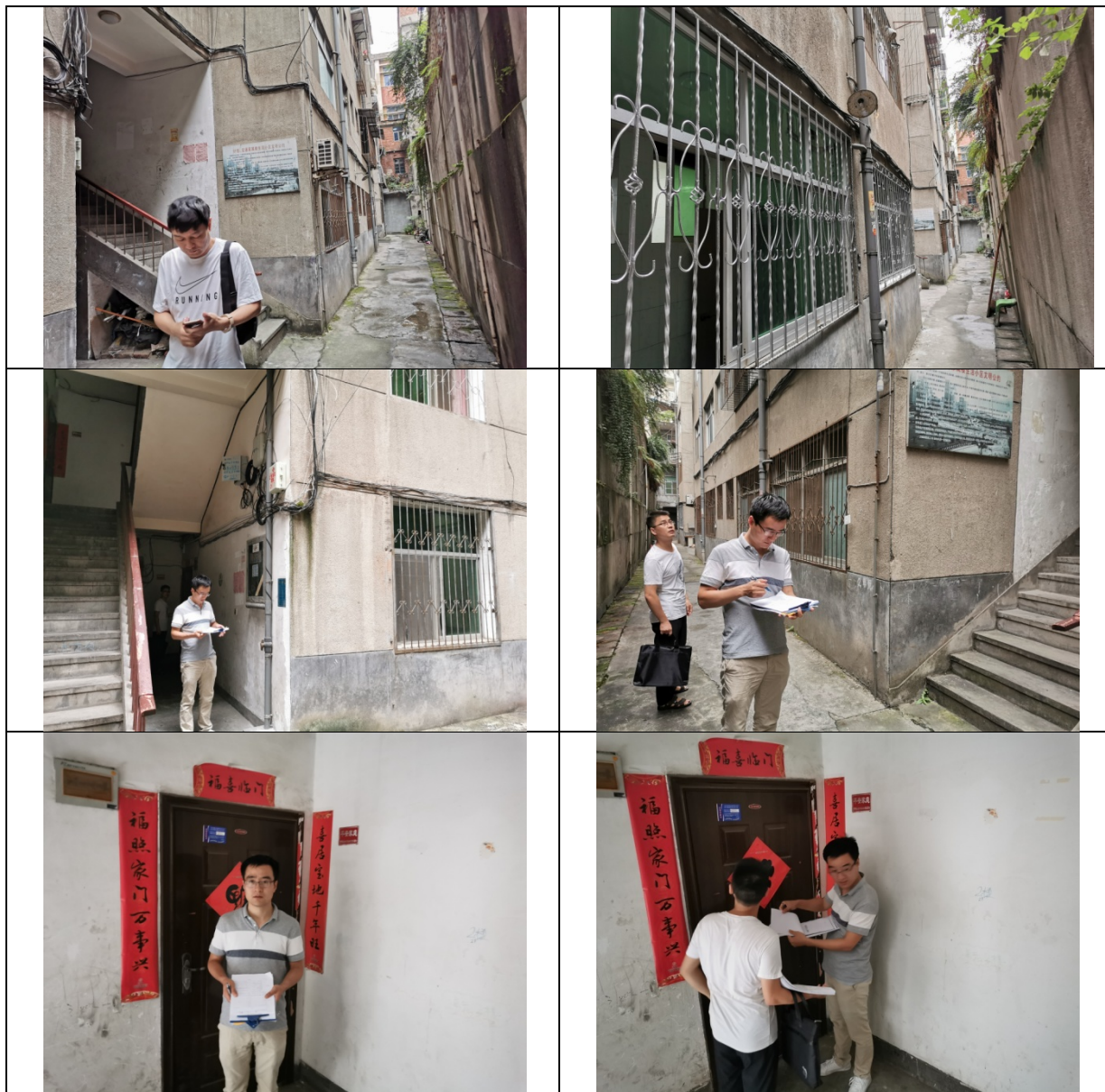
图4 估价对象现状照片