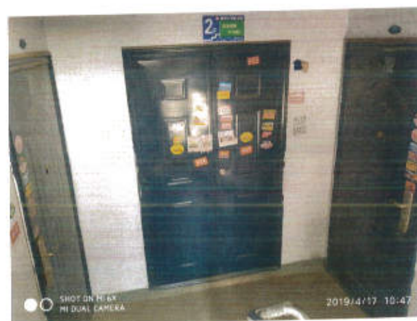
估价对象现状利用照片