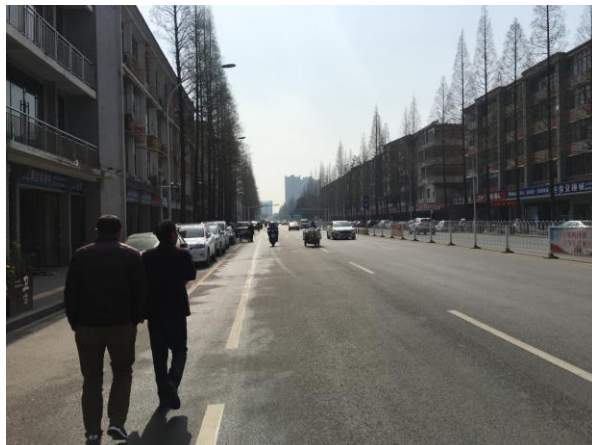
估价对象周边道路二