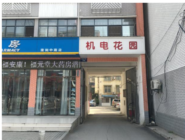
估价对象小区大门