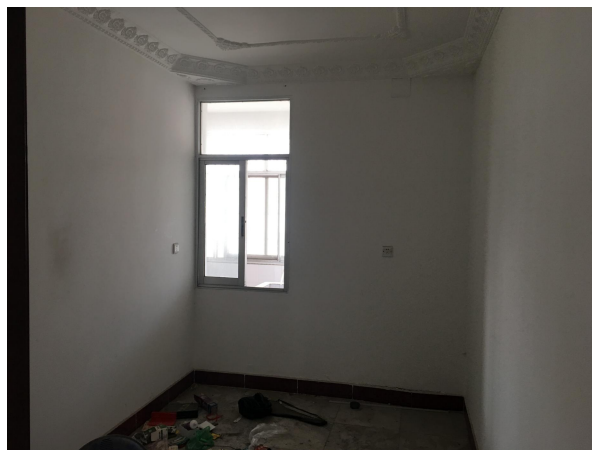
估价对象内部状况三