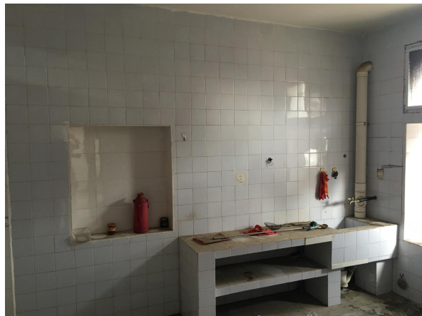
估价对象内部状况五