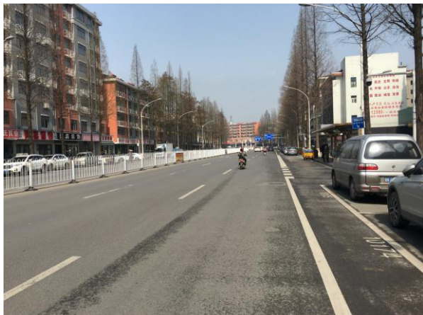
估价对象周边道路一