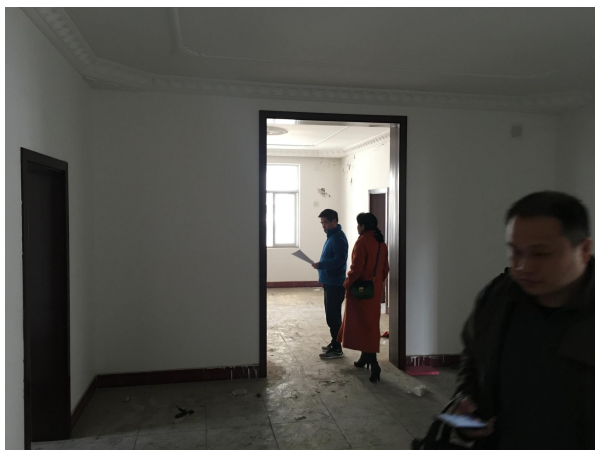
估价对象内部状况二