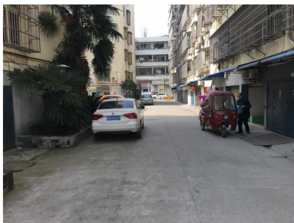
估价对象小区道路