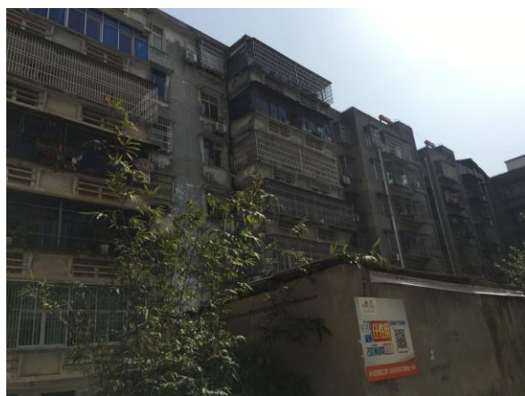
估价对象整体外观