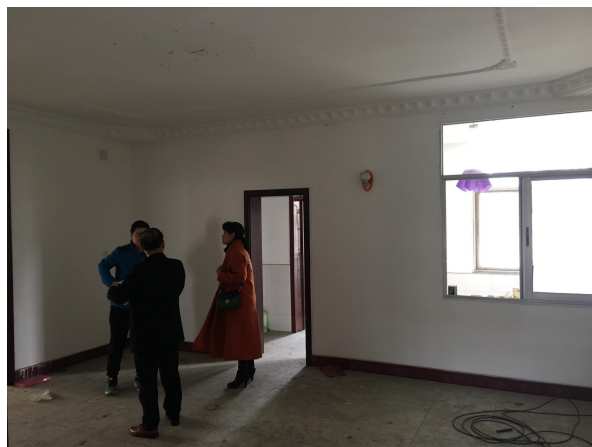
估价对象内部状况一