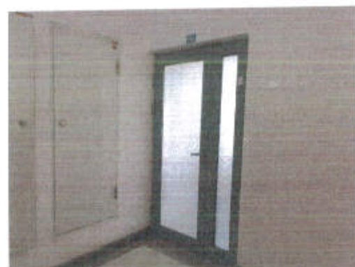
估价对象利用现状照片