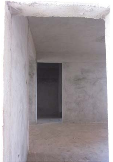
估价对象内部状况