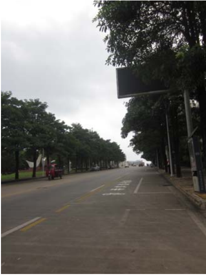
估价对象小区临的文化北路