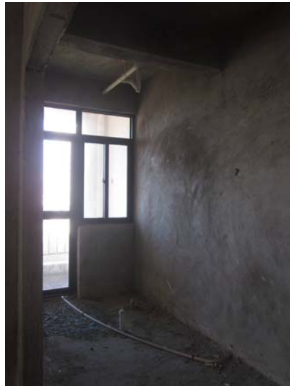
估价对象内部状况