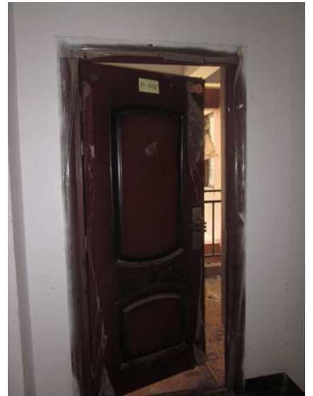
估价对象内部状况