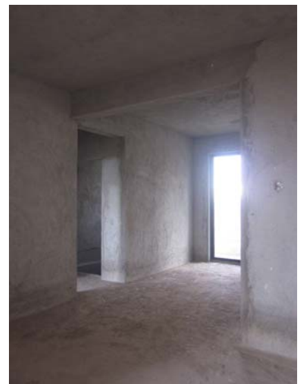
估价对象内部状况