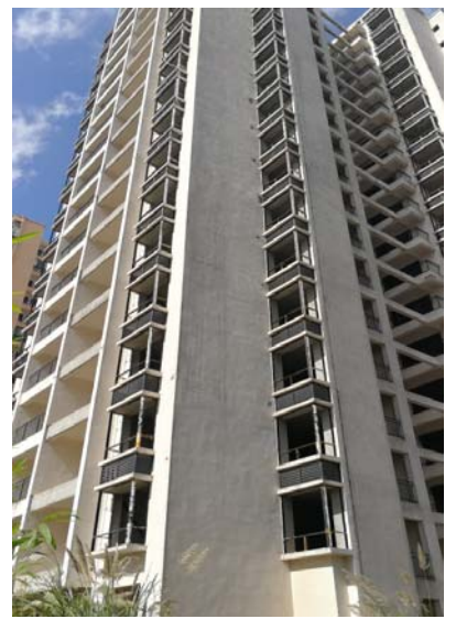
估价对象 18 栋建筑外观