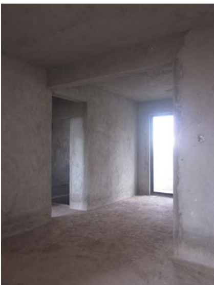
估价对象内部状况