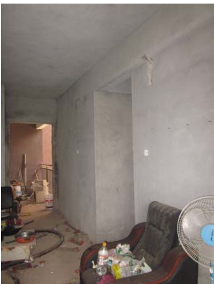
估价对象内部状况