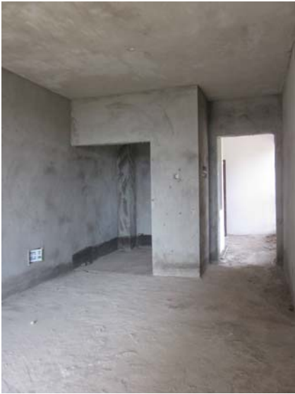
估价对象内部状况