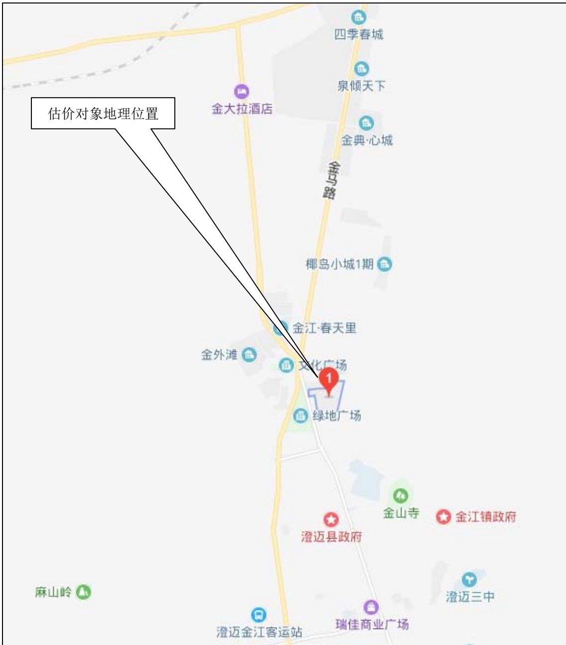
估价对象地理位置示意图