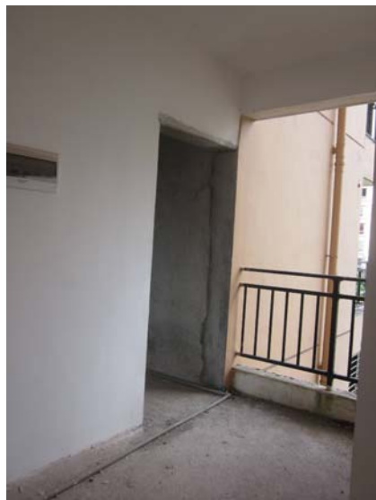
估价对象内部状况