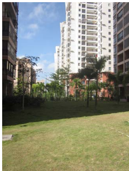
估价对象所在小区花园