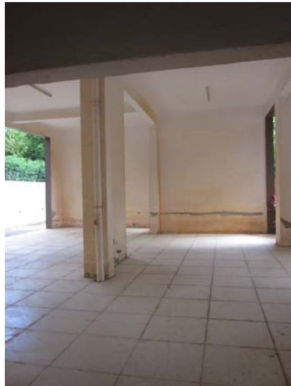
估价对象在建筑架空层