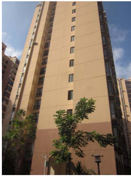
估价对象部分建筑外观