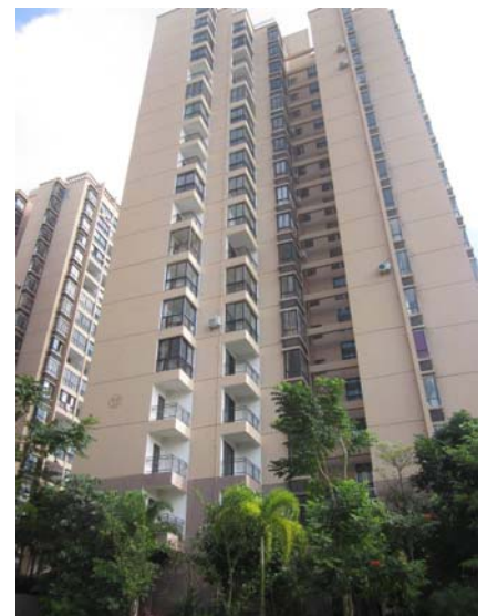
估价对象部分建筑外观