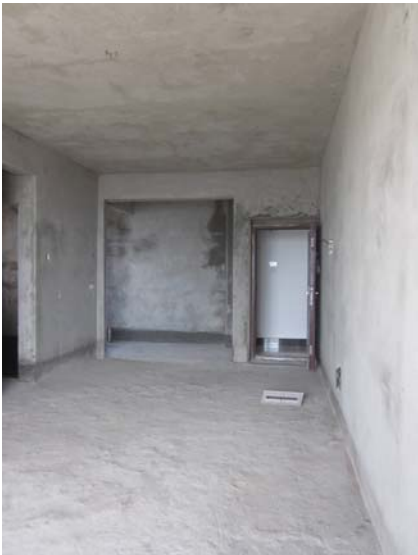
估价对象内部状况