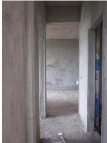
估价对象内部状况