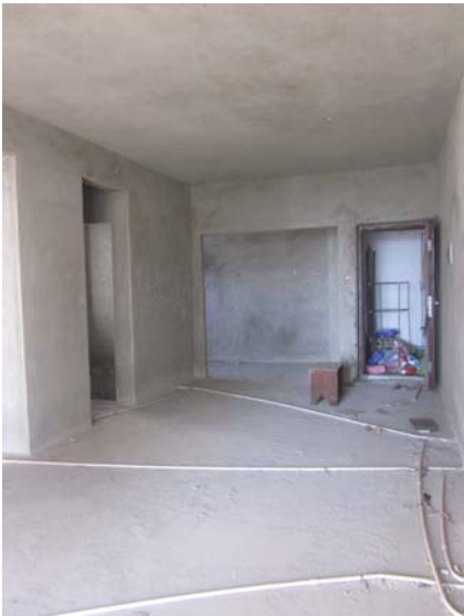
估价对象内部状况