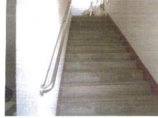
估价对象利用现状照片