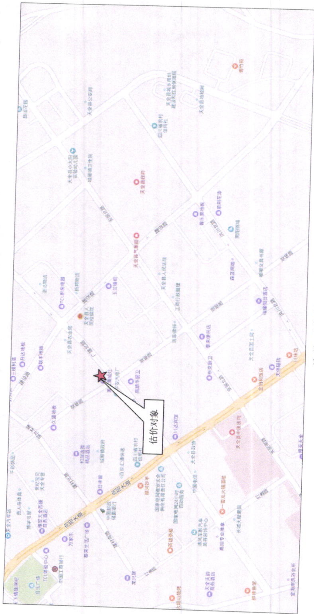
估价对象地理位置图