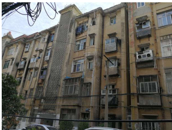
估价对象所在楼整体外观