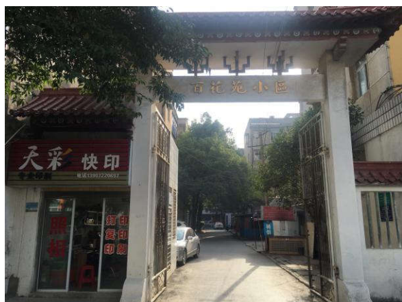
估价对象小区入口