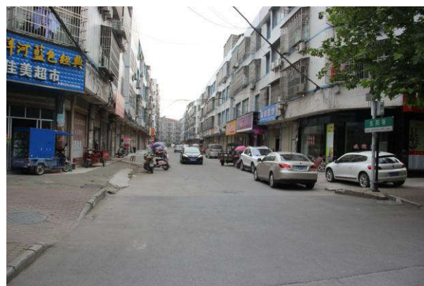
估价对象门前道路