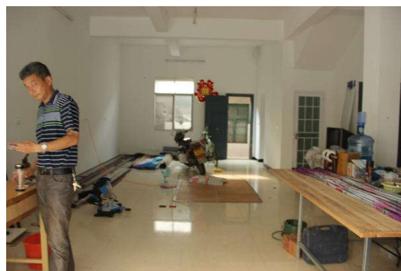
估价对象一楼内部状况