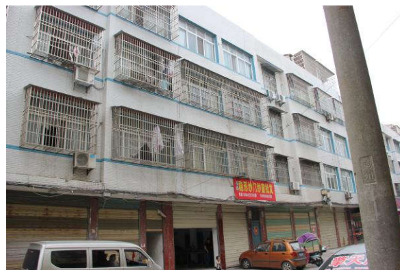
估价对象整体外观