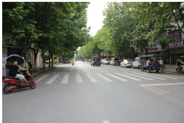
估价对象周边道路二