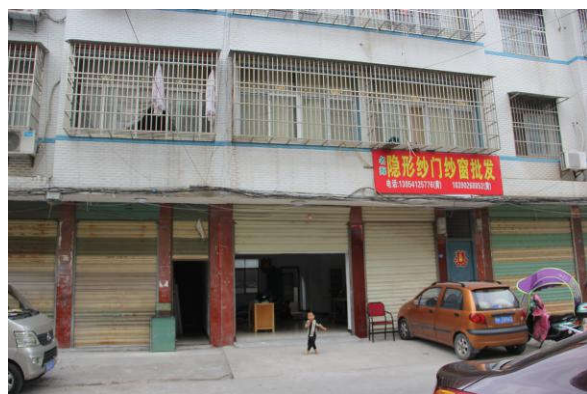
估价对象一楼入口