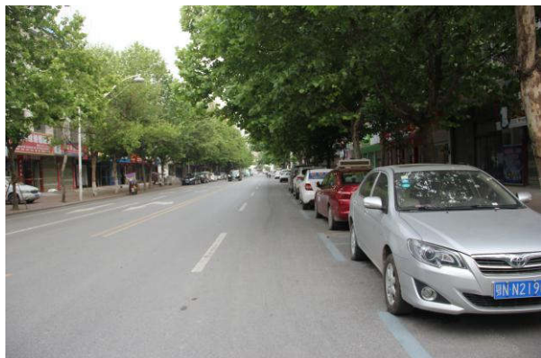
估价对象周边道路一