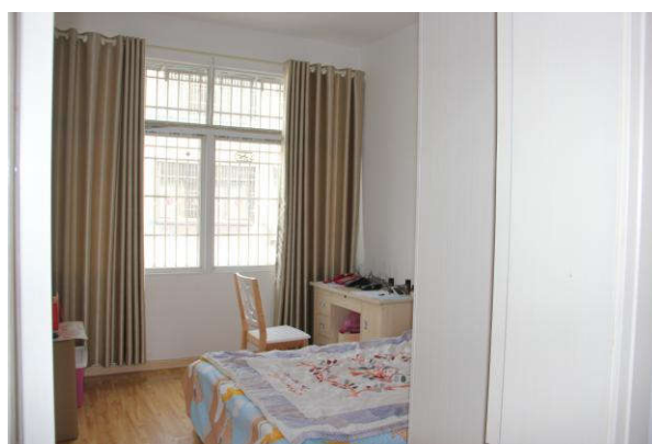
估价对象三楼房间一