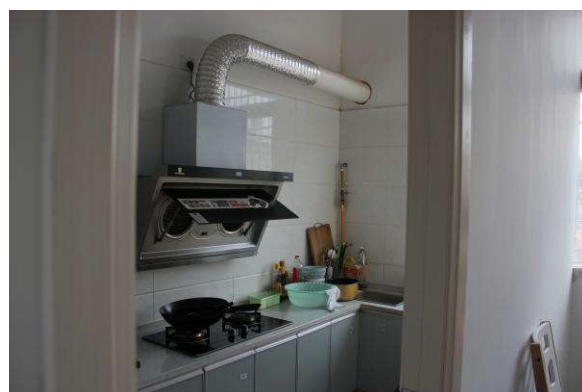
估价对象三楼厨房