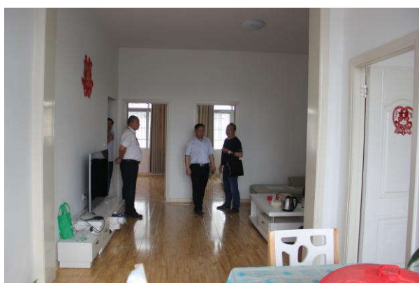
估价对象三楼客厅