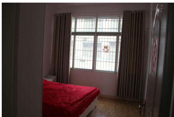
估价对象三楼房间二