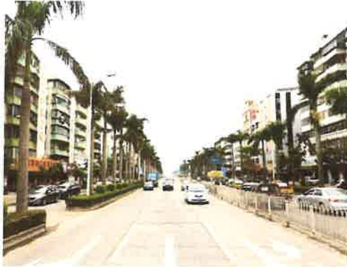
估价对象临路状况