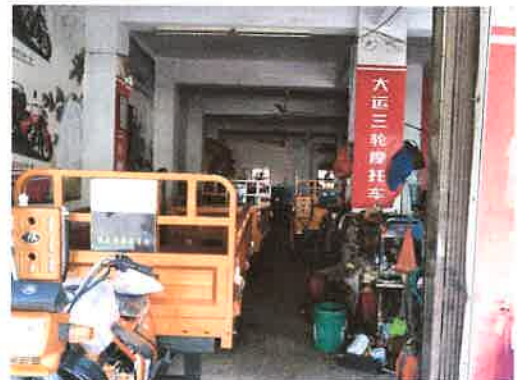
估价对象室内状况