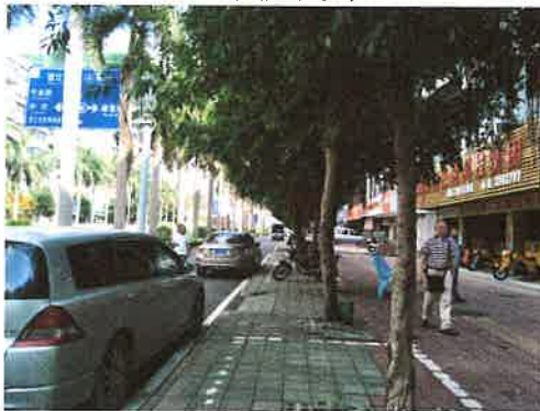
估价对象临路状况