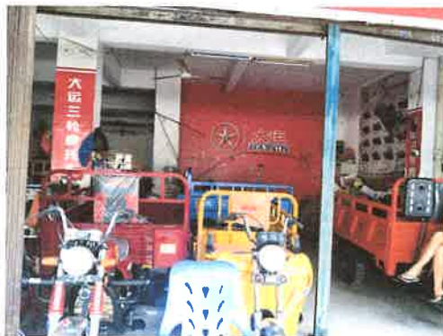
估价对象室内状况