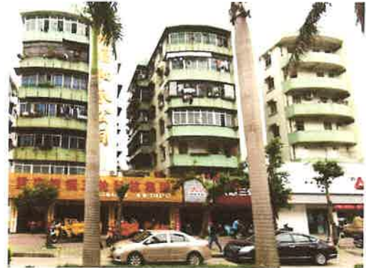
估价对象楼体外观状况