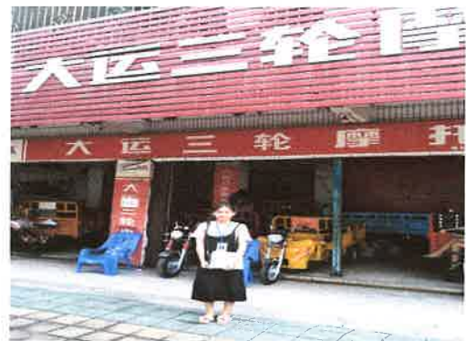
估价对象门口状况