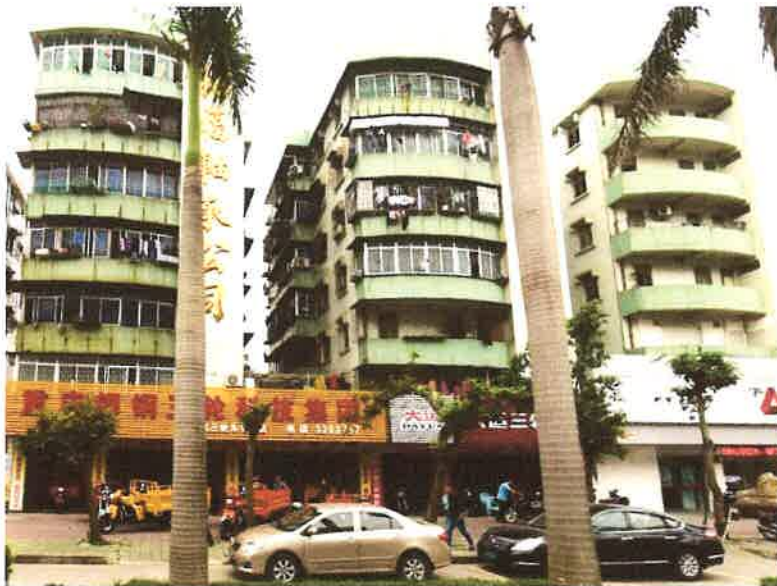
估价对象楼体外观状况