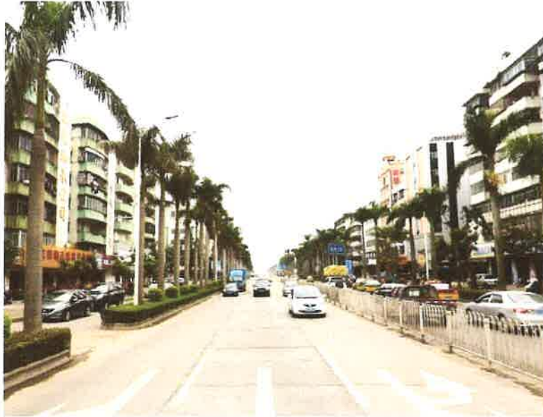
估价对象临路状况