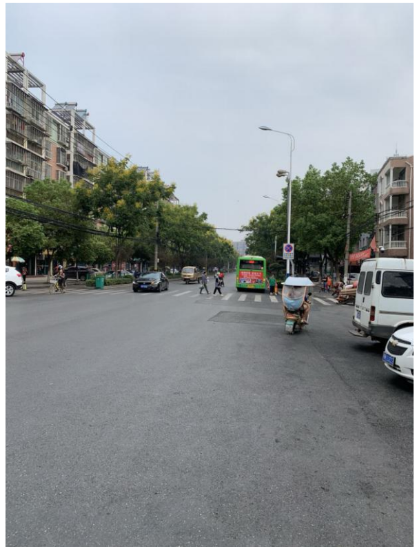
标的所在小区周边环境