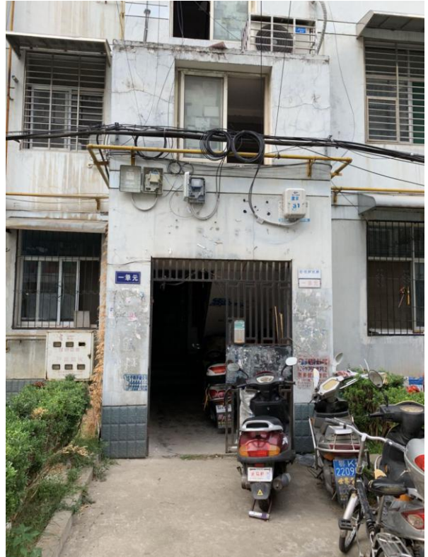
标的所在楼宇入口