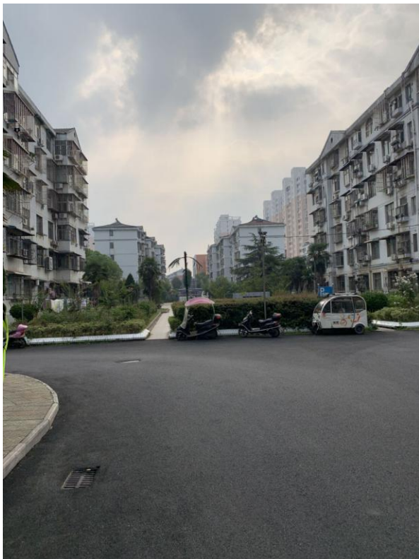
标的所在小区内部环境