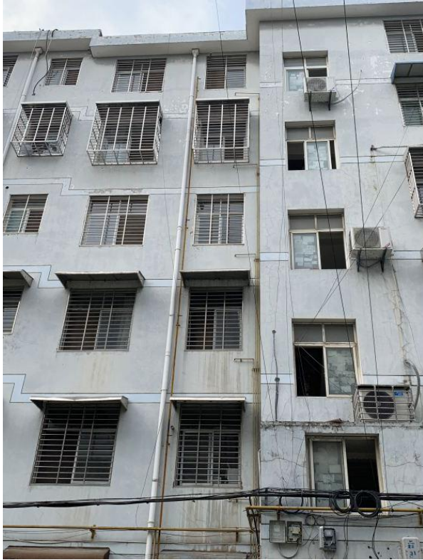
标的所在楼宇外观