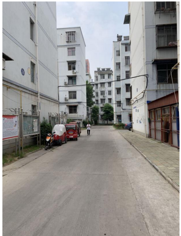
标的所在小区内部环境