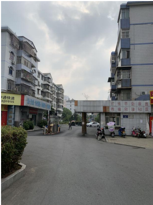
标的所在小区门口