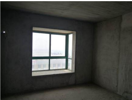
室内 (2-1403 号房)