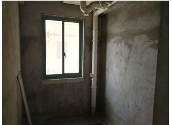
室内 (2-1403 号房)