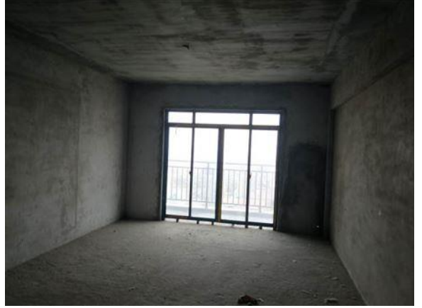
室内 (2-1403 号房)