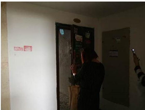
入户门 (2-1503 号房)