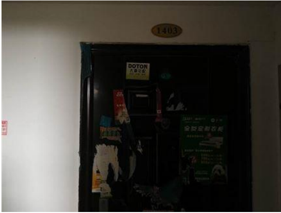
入户门 (2-1403 号房)