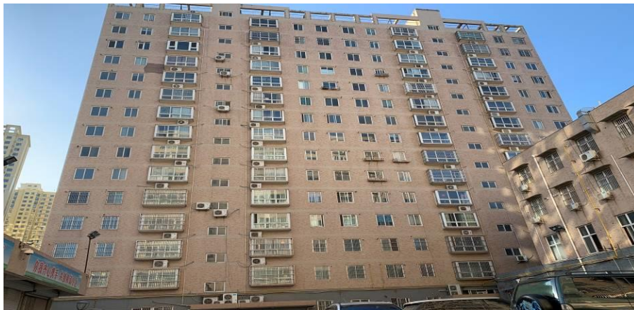
估价对象楼宇外观

现场查勘，估价对象所在的临渭区检察院家属院有3幢楼宇，其中A幢和C幢为住宅楼，B幢为商铺，均于2007年建成并投入使用。