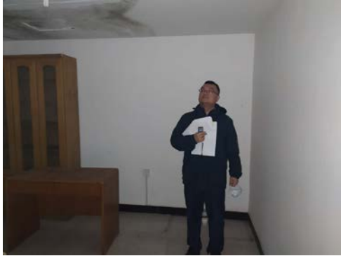
估价对象6 注册房地产估价师现场照片