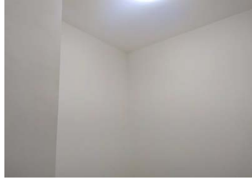
估价对象4 内部照片