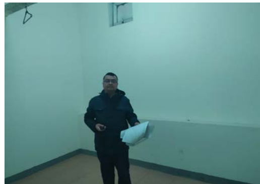
估价对象5 注册房地产估价师现场照片