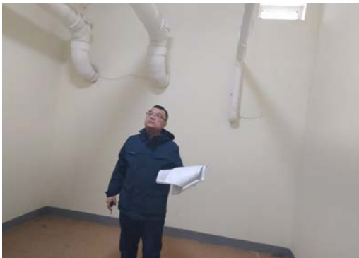
估价对象 10 注册房地产估价师现场照片