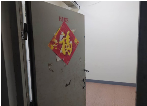
估价对象 2 入户门