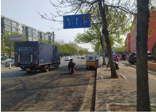
估价对象周边环境