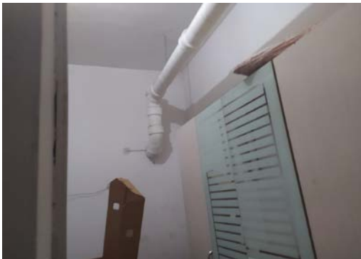
估价对象 11 内部照片