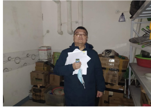
估价对象7 注册房地产估价师现场照片