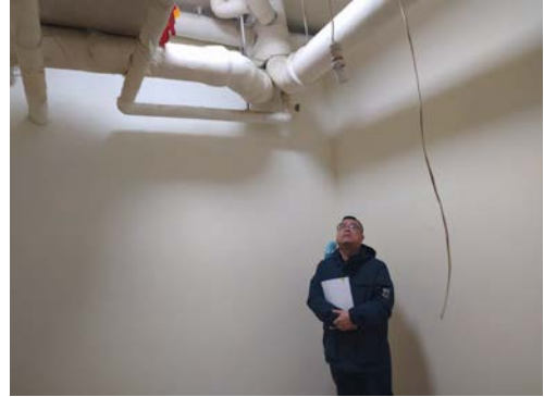
估价对象 1 注册房地产估价师现场照片