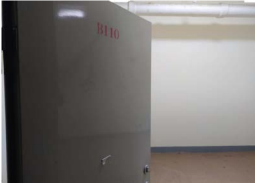
估价对象 10 入户门