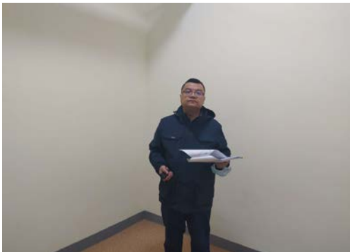
估价对象 2 注册房地产估价师现场照片