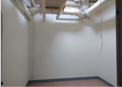
估价对象 1 内部照片