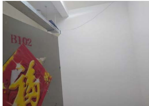
估价对象 2 内部照片