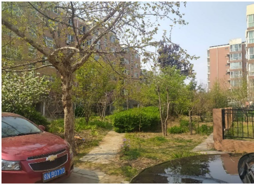
估价对象小区环境