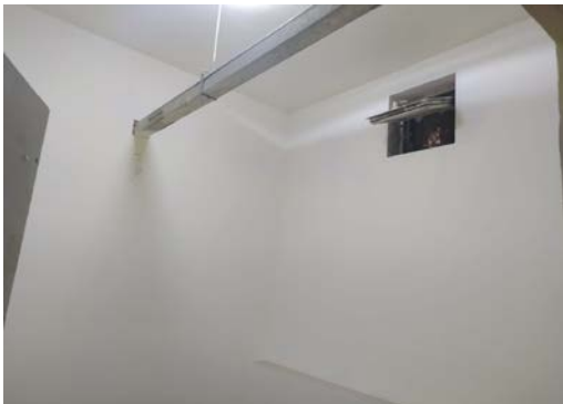
估价对象 3 内部照片