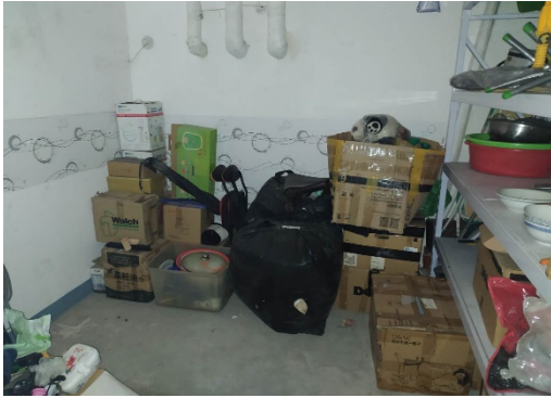
估价对象7 内部照片