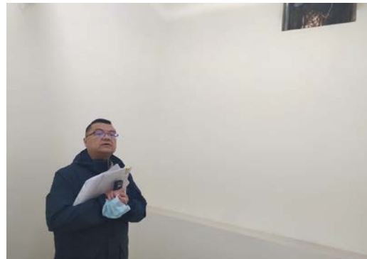
估价对象 3 注册房地产估价师现场照片