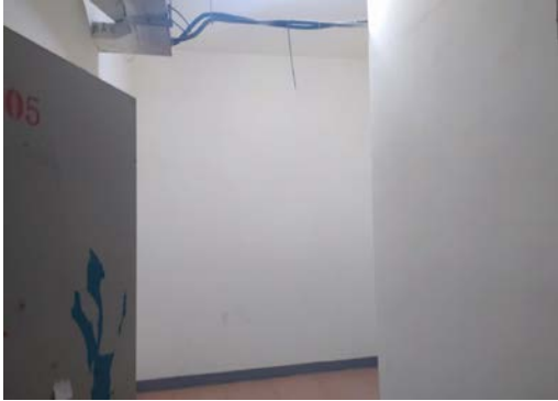
估价对象 9 内部照片