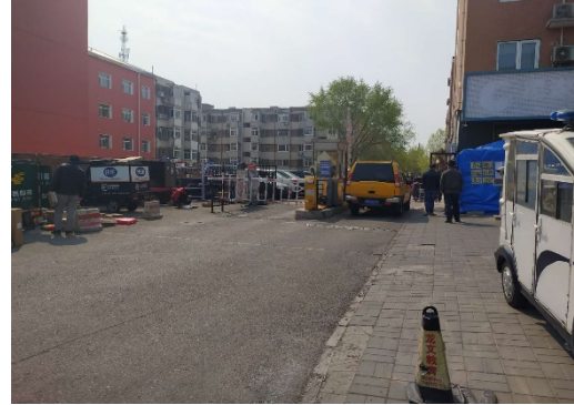
估价对象小区入口