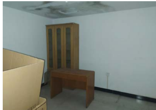
估价对象6 内部照片