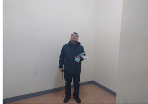
估价对象 9 注册房地产估价师现场照片