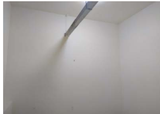
估价对象8 内部照片