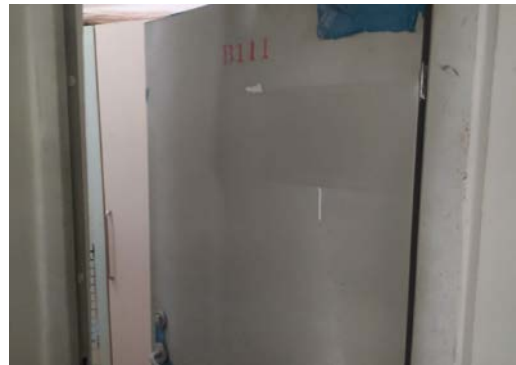
估价对象 11 入户门