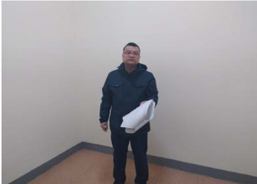
估价对象4 注册房地产估价师现场照片