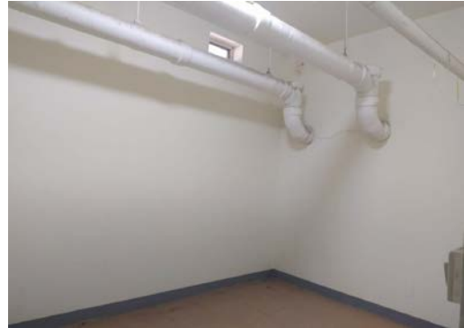
估价对象 10 内部照片