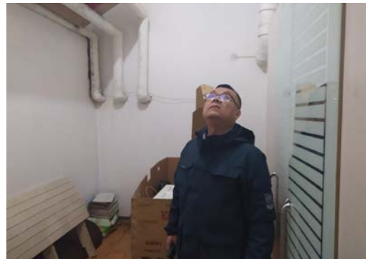
估价对象 11 注册房地产估价师现场照片