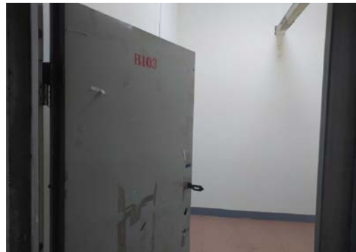
估价对象 3 入户门